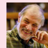
David LE BRETON Professeur émérite à l'université de Strasbourg, titulaire de la chaire Anthropologie des mondes contemporains à l'Institut des études avancées de l'université de Strasbourg (USIAS)...

La défiance envers les institutions de santé, les refus de soin ou encore la montée des discours complotistes témoignent d'une fracture croissante entre citoyens et systèmes de santé. Cette crise de confiance interroge directement la relation soignant-soigné, mais aussi la légitimité des politiques publiques. Elle révèle un conflit entre l'intérêt collectif — protéger la santé publique — et l'intérêt individuel, souvent perçu comme menacé par des injonctions ou des normes jugées contraignantes. Répondre à cette problématique ne peut se réduire à corriger des « fake news » : il s'agit de reconstruire un lien de confiance, en plaçant l'écoute, l'éthique de la communication et la justice sociale au cœur de la relation de soin et des politiques de santé.