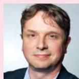
Vincent LAUGEL Neuropédiatre, professeur des Universités, Hôpitaux Universitaires de Strasbourg